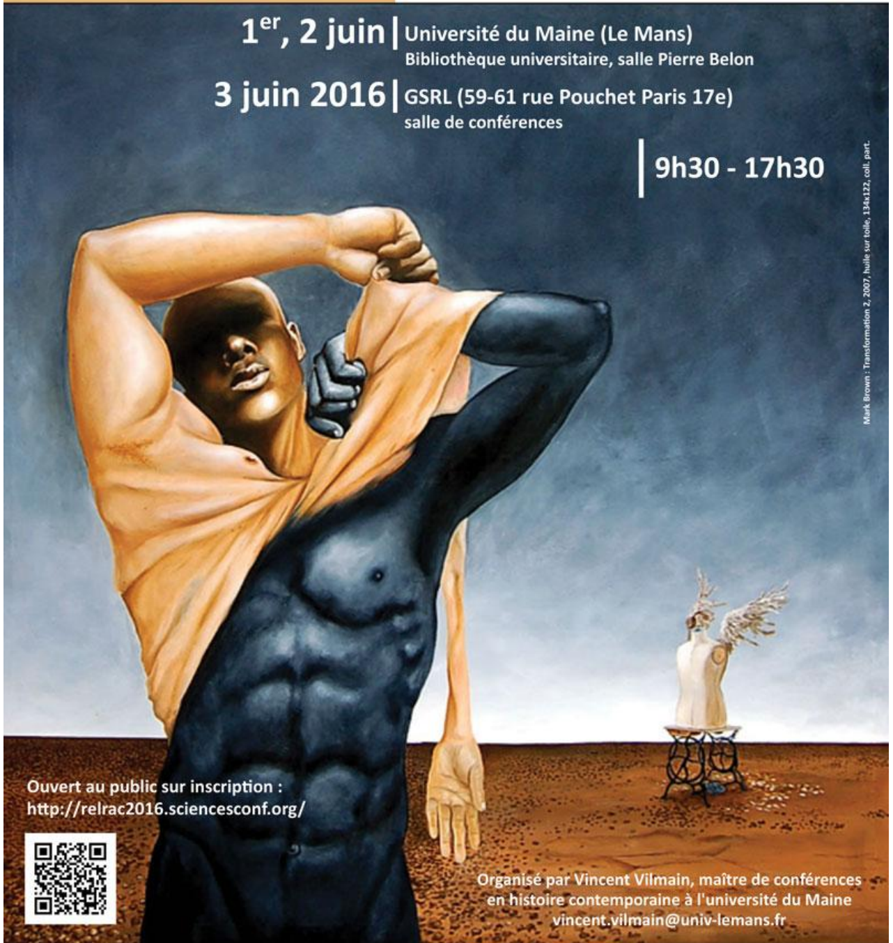
Mark Brown : Transformation 2, 2007, huile sur toile, 134x122, coll. part.

Ouvert au public sur inscription : http://relrac2016.sciencesconf.org/